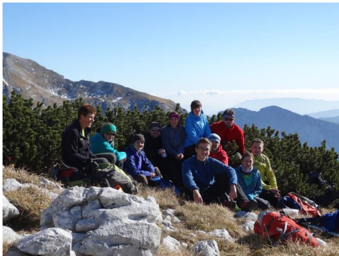
Slika 3 Naša družčina na vrhu Kogla.

Po okrepčilu in skupinskem fotografiranju smo odšli naprej do Bivaka pod Grintavcem od tam pa po zavarovani planinski poti do bivaka pod Skuto.