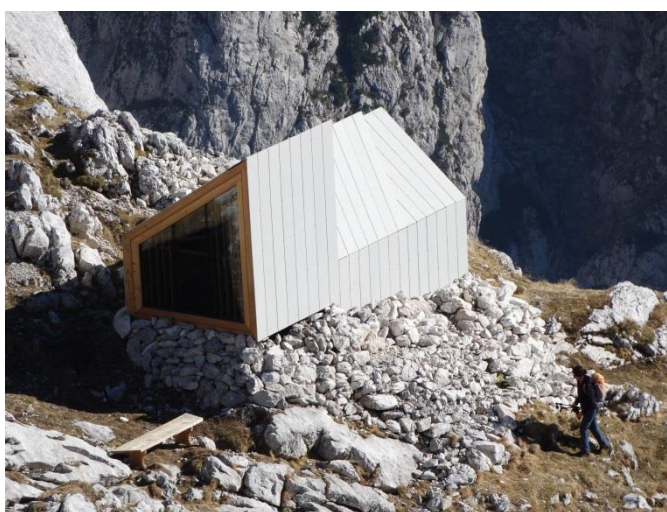
Slika 4 Bivak pod Skuto.

Nekatere člane je moderno gorsko prenočišče tako navdušilo, da so že izdelali plan za silvestrovanje. Okoli bivaka je bilo kar nekaj pohodnikov med njimi tudi člani Alpinističnega odseka Idrija s katerimi smo prijetno pokramljali in se dogovorili za kakšne skupne ture v prihajajoči zimi.