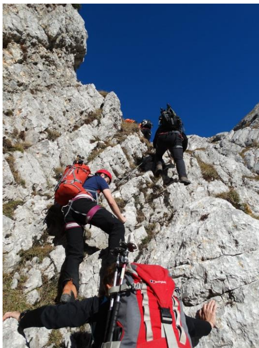
Slika 1 Vzpon na Kogel

Zadnji dan meseca oktobra leta 2015 smo se v okviru alpinistične šole Alpinističnega odseka Celje-Matica podali na spoznavno turo. Skupina enajstih ljudi od tečajnikov prve stopnje pa do izkušenih alpinistov smo se ob 5:30 h zbrali na parkirišču pred nakupovalnim centrom v Levcu. Kot se spodobi smo bili vsi točni, razdelili smo se v tri avtomobile in se odpeljali novim vzponom naproti. Naša izhodiščna točka je bila malo naprej od doma v Kamniški Bistrici na nadmorski višini približno 900 m. Po neoznačeni zelo zahtevni poti imenovani »V Koncu - Kogel (čez Gamsov skret)« smo krenili proti Koglu. Vreme nam je bilo naklonjeno. Ob jutranji zarji je bila temperatura hladno jesenska in nebo brez oblaka.