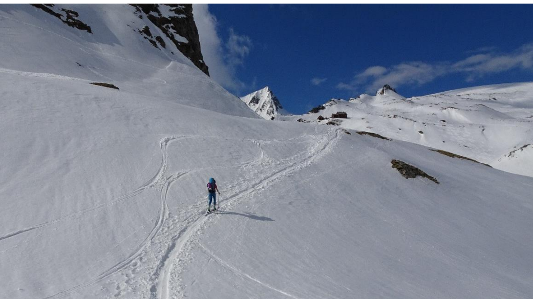
Vzpon proti koči Defreggerhaus.

Pri koči Johannishütte, ki se nahaja na 2121m, smo se okrepčali z lokalnimi dobrotami. V bližini koče se nahajajo številni balvani, ki ponujajo plezanje s pogledom na Großvenediger; (namig za ljubitelje balvanskega plezanja, ki bi utegnili to zgledno urejeno kočo, obiskati v poletnih mesecih).